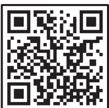
(출처) 온라인 영상 속 아동 인권보호 가이드 (아동권리보장원, 2021)

※ CCL 공식 홈페이지 ( http://ccl.cckorea.org )